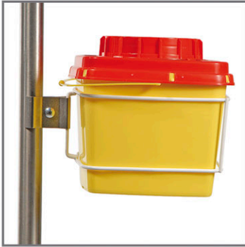
Supporto muro/carrello con pinza