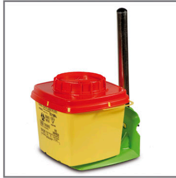
Supporto da carrello in resina