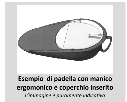
Esempio di padella con manico ergonomico e coperchio inserito L'immagine è puramente indicativa

Creare intorno al paziente un livello di intimità sufficiente ad evitargli situazioni di imbarazzo; ove possibile allontanare le persone estranee altrimenti fare uso di strutture di riparo "paravento".